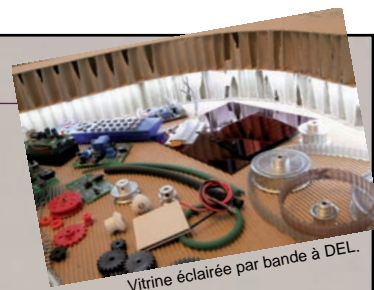
Vitrine éclairée par bande à DEL.

Bande autocollante flexible à DEL Idéal pour les meubles cartons : ne chauffe pas, alimentation très basse tension sans danger. Facile à poser, se recoupe à la longueur souhaitée. Eclairage blanc, 1600 mcd par DEL. Bande autocollante de 300 DEL, soit 5 m x10 mm. Consommation totale (pour les 300 DEL) 18 W. Alimentation 12 V. - La bobine de 5 m. Réf. V-CHLS23WW. 55,62 € HT